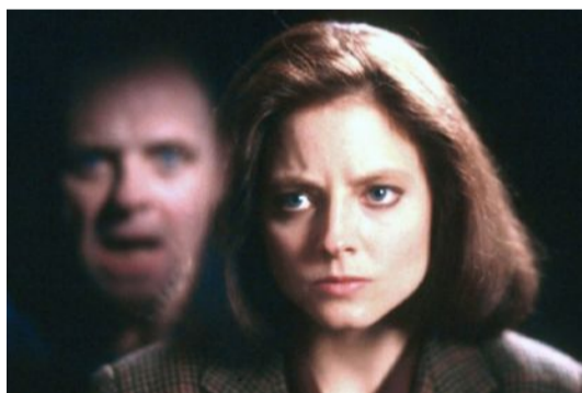
Dalla Cbs il dopo 'Silenzio degli innocenti'

Set televisivo-cinematografici off limits, tempi di ripresa delle lavorazioni al momento incerti o del tutto sconosciuti. Ridimensionando gli investimenti per l'emergenza sanitaria, i network televisivi vanno a pescare dai propri archivi. La Nbc riapre i vecchi armadi: tutti i 'Chicago' (Fire, Med, Pd), 'Law and Order', 'The Blacklist', 'Good girls', tra gli altri. L'Abc ha già detto sì al ritorno del cult 'Grey's Anatomy' e la Cbs riproporrà classici come 'Blue bloods', 'Bull', 'Fbi' e molto altro 'usato sicuro', a partire dalla serie 'Ncis' in tutte le sue declinazioni (di base, Los Angeles, New Orleans). Sempre Cbs ha appena commissionato un reboot al femminile de 'Il Giustiziere della notte' interpretato da Queen Latifah e 'Clarice' dedicata all'iconica agente dell'Fbi Clarice Starling, che verrà raccontata nel periodo dopo i fatti de 'Il silenzio degli innocenti'. In cantiere, fra le altre, anche una nuova serie di 'Star Trek' incentrata sul Capitano Pike e una sulla saga di 'Percy Jackson e gli dei dell'Olimpo'. ANSA/RED