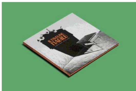
'Il tavolino magico', tra i primi 5