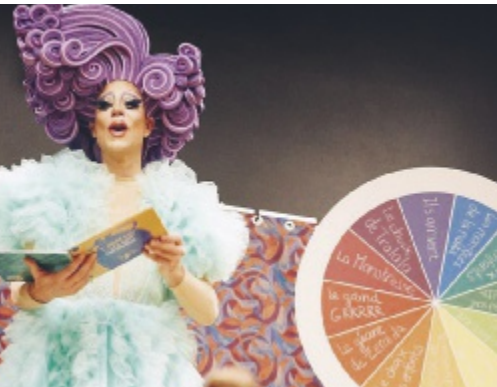
Tralala Lita au festival BDFIL, octobre 2022

CÉLINE CERNY, MÉDIATRICE CULTURELLE AU LABORATOIRE DES BIBLIOTHÈQUES DE LA FONDATION BIBLIOMEDIA