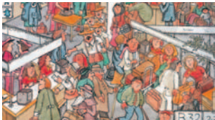
Illustration von Rolf Rettich (Das Buch vom Fliegen, 1991).

Im heutigen Massentourismus sind die grossen Reisebüros die Supermärkte der mobilen Gesellschaft. Die Prospekte übertrumpfen sich gegenseitig in kräftigen Farben mit verlockenden Angeboten, die in alle Himmelsrichtungen führen. Der Charters tourist auf den grossen Flughäfen wird umspült von unzähligen exotischen Reise destinationen. Und wo immer er ankommt: wieder sieht er sich mit einer bunten Palette von Möglichkeiten der Freizeitgestaltung konfrontiert. Die Welt des Tourismus durchdringt die Welt und bildet eine Welt für sich!