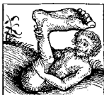
Holzschnitt aus Hartmann Schedels «Weltchronik», 1495.

Der sachliche Reisebericht, die gefühlsbetonte Reisebeschreibung und der fiktive Reiseroman – sie gehen fließend ineinander über. Reiseliteratur, sei es in Form von Berichten über tatsächliche oder über erfundene Reisen, weckt stets die Neugier breiter Kreise; sie ist eine der ältesten Literaturgattungen überhaupt.