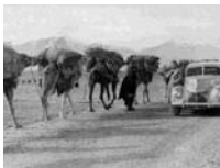
Auf dem Weg zum Khyber-Pass, Dezember 1939.