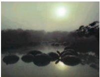
Ein Bild wie aus grauer Vorzeit dämmt herauf, wenn die Sonne über dem Wasser auf den Galapagos-Inseln aufgeht.

Und heute? Entdeckungen zu machen heisst heute nicht, Handelswege oder Siedlungsland zu finden. Forschen soll dazu führen, ein besseres Verständnis der Welt zu erlangen. Mehrere Hundert der höchsten Berge sind noch nicht bestiegen. Das Blätterdach des Regenwaldes birgt noch unzählige Schätze an unbekanntem Pflanzen und Tieren. Und noch immer wissen wir nicht viel über den Meeresboden. Immer wieder wird der Mensch die Welt befragen und nach neuen Antworten suchen.