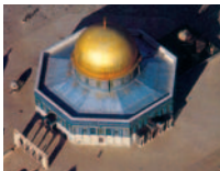
Der Felsendom in Jerusalem.