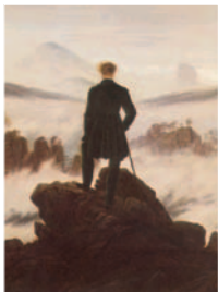
«Der Wanderer über dem Nebelmeer» von Caspar David Friedrich, um 1818.