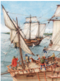
Die drei Schiffe, mit denen Columbus die Neue Welt entdeckte: die Santa María, die Niña und die Pinta.

Am 3. August 1492 stach Columbus mit der Santa María und zwei weiteren Segelschiffen in See. Westwärts sollte die Reise gehen. Ziel waren die Gewürzinseln Indonesiens. Nach langen Entbehrungen sichteten sie endlich Land. Statt einen Seeweg nach Indonesien gefunden zu haben, entdeckte Columbus eine «neue Welt»: Amerika. Bei genauerem Hinsehen erweist sich dieses «Amerika» dann allerdings als die in der Nähe von Kuba liegende Insel San Salvador.