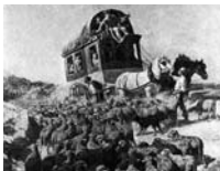
Reisen mit der «Diligence», Ende 19. Jahrhundert.

Seit dem 14. Jahrhundert waren Handwerksgesellen in Europa unterwegs. Ihr Ziel war es, dereinst als Meister sesshaft zu werden. Mit der Aufhebung der Zünfte in der 2. Hälfte des 19. Jahrhunderts und der Neuregelung des Ausbildungssystems fanden diese Wanderschaften ein Ende. Immer schon unternahmen Kaufleute ausgedehnte Reisen auf der Suche nach neuen Erwerbsquellen. In der Neuzeit blieb der Grosskaufmann zu Hause und dirigierte die Geschäfte vom Kontor aus. Die Führung der Warentransporte übernahmen in seinem Auftrag Handelsdiener und Fuhrleute. Die Reisetätigkeit nahm ständig zu, die Märkte verdichteten sich. Aus dem Reisediener wurde im 19. Jahrhundert der moderne Handelsreisende. Ebenfalls zu Erwerbszwecken zog im 18. und 19. Jahrhundert ein Heer von Hausierern mit Waren über Land, die sie in den Dörfern verkauften. Zugleich dienten sie als «lebende Zeitung» auch der Informationsverbreitung. Aus wirtschaftlicher Not suchten viele Menschen ihr Glück in der Fremde. Bis 1850 ging die Reise der Auswanderer an die Wolga, nach Ungarn oder ans Schwarze Meer. Später war Nordamerika, das «Land der unbegrenzten Möglichkeiten», das begehrte Reiseziel.