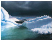
Die Paradiesbucht, einer der reizvollsten Plätze der antarktischen Halbinsel.

Im späten 18. Jahrhundert ging es nicht mehr nur um die Entdeckung unbekannter Welten. Diese sollten vielmehr auf Karten erfasst, genau vermessen und untersucht werden. Das Zeitalter der wissenschaftlichen Entdeckung hatte begonnen. Auf drei Schiffsreisen im Zeitraum von 1768-1779 erforschte Captain James Cook die Küsten Australiens und Neuseelands sowie Inseln im Pazifik. Er drang zum Eismeer im Süden vor und umsegelte die Antarktis.