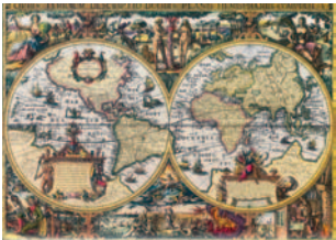
Niederländische Weltkarte aus dem Jahr 1632.

Neugier und Notwendigkeit sind die zwei Hauptantriebskräfte, die Menschen veranlassen, auf Reisen zu gehen. Die Geschichte der Menschheit wird von Phasen der Sesshaftigkeit und solchen der Migration geprägt. Wurde der Lebensraum aufgrund von Veränderungen der Umwelt oder aufgrund von Besetzung durch eindringende Völker zu eng, gingen ganze Völker auf Wanderung. Völker nahmen untereinander zwecks Förderung von Handel oder Politik Beziehungen auf – auch diese Beziehungen führten zu ausgedehnter Reisetätigkeit. Solches hat heute noch Gültigkeit. Im Verlauf der Geschichte wurden die Kontinente auf Handelsreisen, Forschungsreisen, Bildungs-, Pilger- und Erholungsreisen durchquert und erkundet.