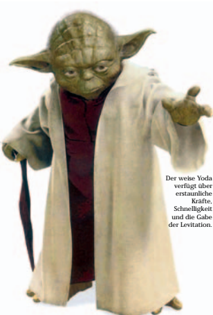
Der weise Yoda verfügt über erstaunliche Kräfte, Schnelligkeit und die Gabe der Levitation.