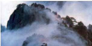
Die Gipfel des Huangshan, des «Gelben Gebirges», in der Provinz Anhui.

Im 13. Jahrhundert brach der junge Marco Polo mit seinem Vater und seinem Onkel zu einer Reise ans Ende der Welt auf. Die drei Reisenden benutzten die Karawanenwege über die hohen Pässe Kaschmirs, durch die Wüste Gobi und die unendlichen Steppen der Mongolei, bis sie endlich in Peking eintrafen. Marco Polo war begeistert vom Reichtum der Städte und dem lebhaften Handel. Überwältigt von den bisher unzugänglichen Herrlichkeiten des Ostens, wurde Marco Polo zu einer Art Botschafter dieser unbekannten Wunderwelt. Nach der Rückkehr diktierte er einen Bericht über seine Reisen. Von Columbus selbst wissen wir, dass er ein Exemplar von Marco Polos «Beschreibung der Welt» bei sich hatte, als er einen neuen Seeweg nach Indien suchte.