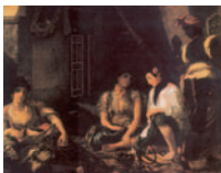
Haremsszene («Die Frauen von Algier») von Eugène Delacroix, 1834.

Schon als Kind entwickelte die Österreicherin Ida Pfeiffer eine Vorliebe für Reiseliteratur und beneidete jeden Weltumsegler und Naturforscher. Sie verschlang einen Reisebericht nach dem andern. Auf ihren Phantasiereisen entfloher sie der Wirklichkeit und der häuslichen Enge. Nach ihrer Heirat und der Erziehung ihrer Kinder geht für Ida endlich ein Traum in Erfüllung: 1842 tritt sie, 44-jährig und ausgestattet mit einer kleinen Summe von Erspartem, allein ihre erste grössere Reise nach Palästina an. Ihre Angelegenheiten hat sie geordnet und ihr Testament gemacht, denn sie hält ihren Tod für wahrscheinlicher als eine Rückkehr. Ihre Erlebnisse fasst sie in einem Tagebuch zusammen, das gleich bei Erscheinen ein Riesenerfolg wird. Von ihrer Reise zurückgekehrt, hält sie es nicht lange in der Enge aus. Immer wieder bricht sie auf zu neuen Ufern: nach Südamerika, Indien, Indonesien, Amerika.