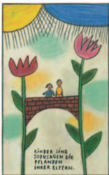
Ill. von Rotraut Susanne Berner zu Jürg Schubigers Buch «Mutter, Vater, ich und sie», Beltz & Gelberg 1997

Hans Manz in: En Elefant vo Äntehuse, Atlantis Verlag 1975