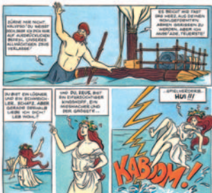
Frida Bünzli: Die Abenteuer des Odysseus, Artemis & Winkler 1992

Was den Menschen im Innersten bewegt und beschäftigt, hat immer auch schon Einlass gefunden in die Literatur. Angefangen bei Mythen, Sagen und Märchen wimmelt es in der Literatur geradezu von Familiengeschichten. So spielen sich im griechischen Olymp laufend Familiendramen und -intrigen ab, an denen Vater Zeus nicht ganz unbeteiligt ist!