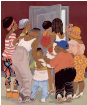
Helen Oxenbury/Trish Cooke: Ganz toll! Sauerländer 1995

Jedes Kind hat ein Recht auf Bildung. Bildung soll Kindern helfen, ihre Persönlichkeit, ihre Begabungen und ihre Fähigkeiten weiterzuentwickeln. Menschen lernen immer, ihr Leben lang. Zur Bildung gehört es auch, Respekt vor anderen zu haben. Bildung ist der Schlüssel zu einer besseren Zukunft. Überall auf der Welt werden Bemühungen unternommen, die Bildungsmöglichkeiten zu verbessern, damit Kinder einen guten Start ins Erwachsenenleben haben.